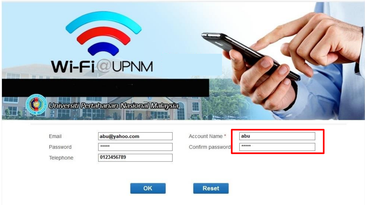
Contoh: Paparan portal bagi komputer riba.