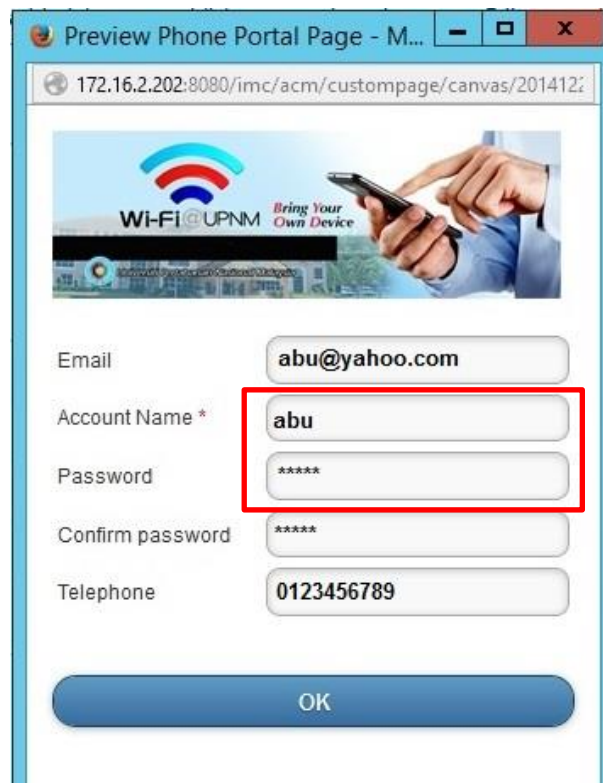
Contoh: Paparan portal bagi telefon pintar.

Selepas pengguna berjaya log-in , pengguna akan dipaparkan dengan maklumat dan pop-up seperti di bawah yang menunjukkan pengguna telah berjaya mengisi Account Name dan Password dengan betul.