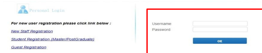
Contoh: Paparan portal bagi komputer riba.